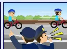
警察官の警告に従わず 歩道通行 続けた場合