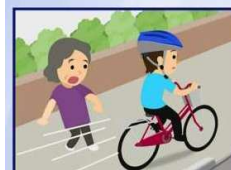
スピードを出し歩道通行 歩行者を驚かせ立ち止ませた場合