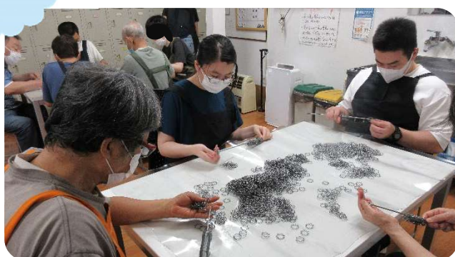
であい工房にて委託作業

富山刑務所より刑務官の方達が 2 名ずつ、 むつみの里で 3 日間の実習を行いました。