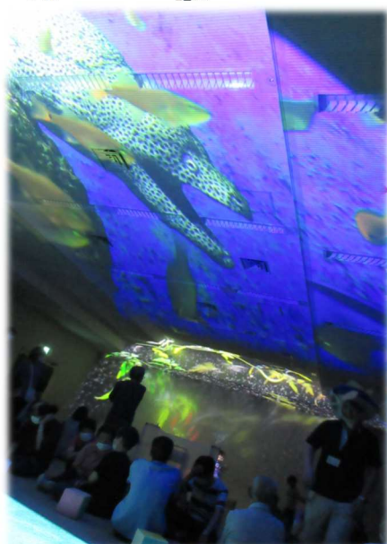
天井に映し出される幻想的な空間