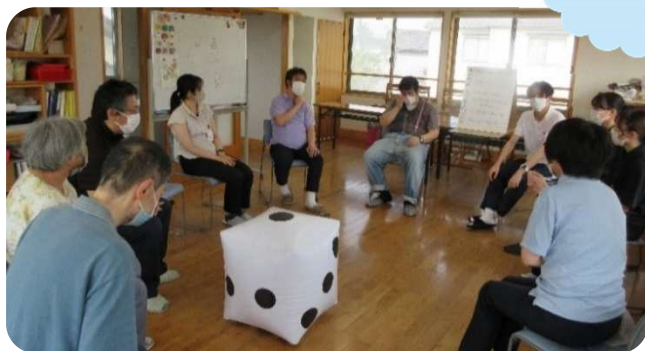
自然房にて実習生考案のレクリエーション

富山県立大学看護学生 1 年生 3 名が、 むつみの里で 3 日間の実習を行いました。