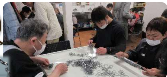
であい工房でリング揃え作業