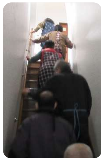
垂直避難をするために 2 階へ