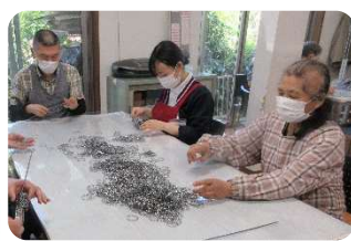
であい工房でリング揃え作業