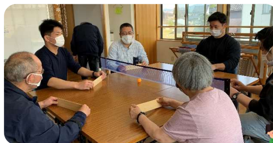
自然房で卓球バレー

1 月から引き続き、富山刑務所の刑務官の皆さんが、であい工房と自然房で実習されました。