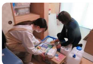
持ち出し備品の確認