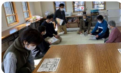
防災に関する講義