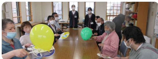
自然房で実習生が考案したレクリエーション