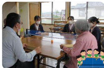
自然房で卓球バレー