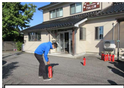
職員による水消火器訓練の説明の様子。