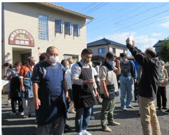
自衛消防本部前に避難し、点呼をしている様子。